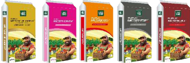
N 15% Ca 26% N 27% CaO 12-15% N 16% P2O5 20% P2O5 46% K2O 60%