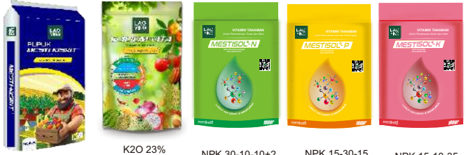
MgO 27%+17%S K2O 23% + MgO 11%+S 15% NPK 30-10-10+2 Plus EDTA TE NPK 15-30-15 Plus EDTA TE NPK 15-10-35 Plus EDTA TE