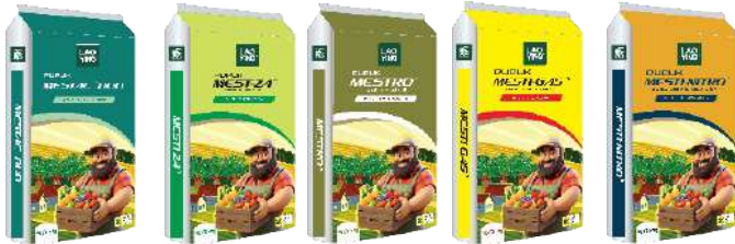
N 25-26% + B N 21% N 21% N 21% N 21%