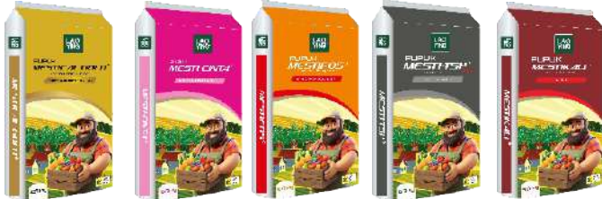
N 15% Ca 26% N 27% CaO 12-15% N 16% P 2 O 5 20% P 2 O 5 46% K 2 O 60%