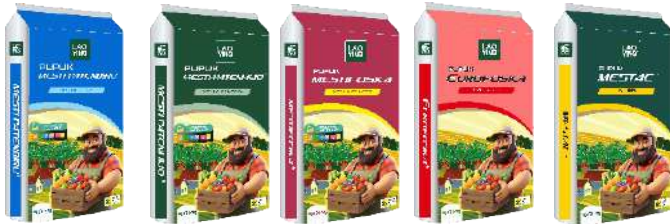
NPK 16-16-16 NPK 15-10-20 NPK 15-15-15 NPK 15-15-15 N 26%