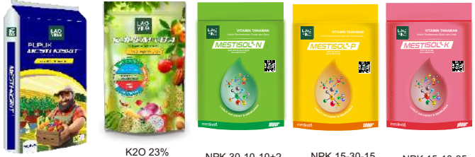
MgO 27%+17%S K 2 O 23% + MgO 11%+S 15% NPK 30-10-10+2 Plus EDTA TE NPK 15-30-15 Plus EDTA TE NPK 15-10-35 Plus EDTA TE