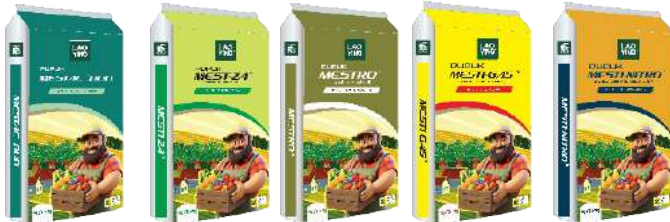
N 25-26% + B N 21% N 21% N 21% N 21%