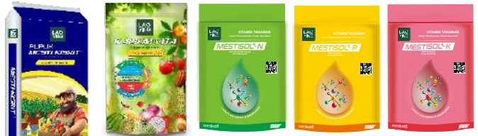
MgO 27%+17%S K 2 O 23% + MgO 11%+S 15% NPK 30-10-10+2 Plus EDTA TE NPK 15-30-15 Plus EDTA TE NPK 15-10-35 Plus EDTA TE