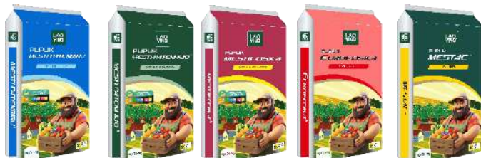
NPK 16-16-16 NPK 15-10-20 NPK 15-15-15 NPK 15-15-15 N 26%