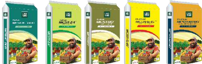
N 25-26% + B N 21% N 21% N 21% N 21%