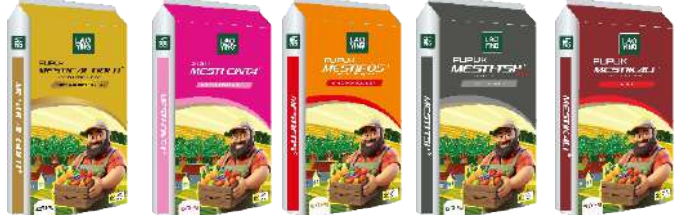
N 15% Ca 26% N 27% CaO 12-15% N 16% P 2 O 5 20% P 2 O 5 46% K 2 O 60%