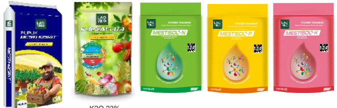
MgO 27%+17%S MgO 11%+S 15% NPK 30-10-10+2 Plus EDTA TE NPK 15-30-15 Plus EDTA TE NPK 15-10-35 Plus EDTA TE