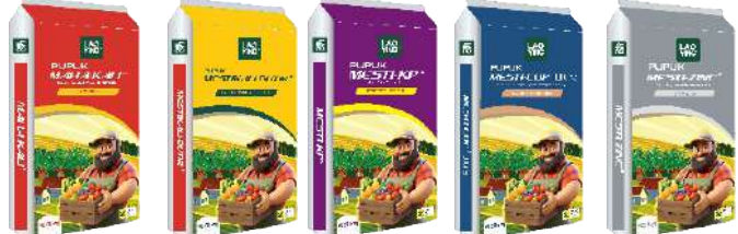
K 2 O 60% K 30%+MgO 15% + S10% P 2 O 5 52% K 2 O 34% Cu 24.5% Zn 21%