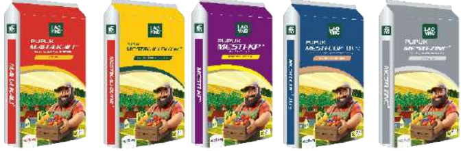
K 2 O 60% K 30%+MgO 15% + S10% P 2 O 5 52% K 2 O 34% Cu 24.5% Zn 21%