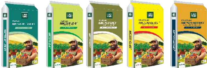
N 25-26% + B N 21% N 21% N 21% N 21%