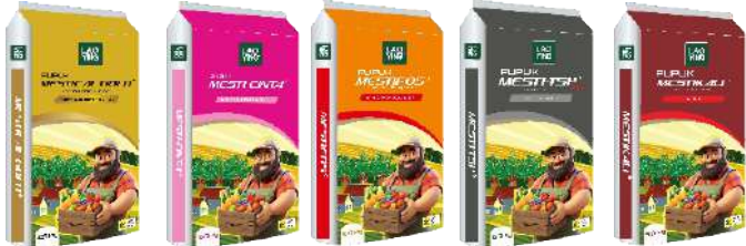
N 15% Ca 26% N 27% CaO 12-15% N 16% P 2 O 5 20% P 2 O 5 46% K 2 O 60%