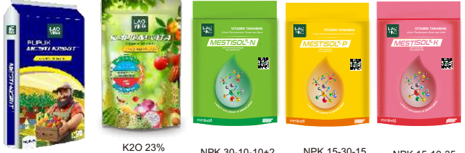
MgO 27%+17% S K 2 O 23% + MgO 11%+S 15% NPK 30-10-10+2 Plus EDTA TE NPK 15-30-15 Plus EDTA TE NPK 15-10-35 Plus EDTA TE