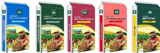
NPK 16-16-16 NPK 15-10-20 NPK 15-15-15 NPK 15-15-15 N 26%