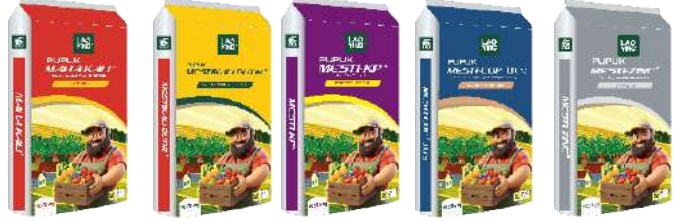
K2O 60% K 30%+MgO 15% + S10% P2O5 52% K2O 34% Cu 24.5% Zn 21%