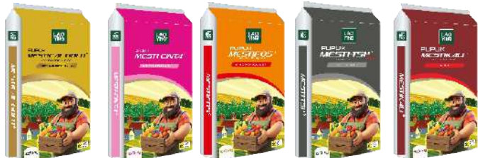
N 15% Ca 26% N 27% CaO 12-15% N 16% P2O5 20% P2O5 46% K2O 60%