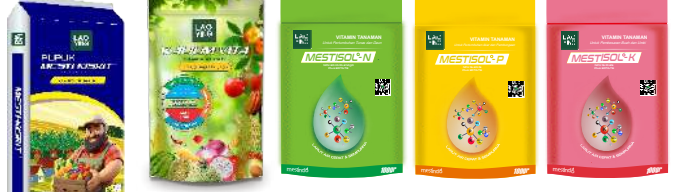
MgO 27%+17%S K2O 23% + MgO 11%+S 15% NPK 30-10-10+2 Plus EDTA TE NPK 15-30-15 Plus EDTA TE NPK 15-10-35 Plus EDTA TE