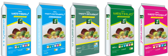
NPK 16-16-16 NPK 16-16-16 NPK 19-9-19 NPK 15-10-20 NPK 15-15-15