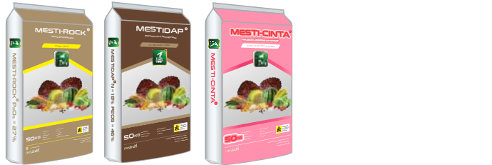
P 2 O 5 27% NP 18-46 N 27%+ CaO 15%