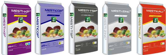
PK 52-34 Cu 24% P 2 O 5 46% Zn 21% K 2 O 60%