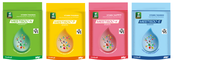
NPK 30-10-10+2 NPK 15-30-15 NPK 15-10-35 NPK 20-20-20