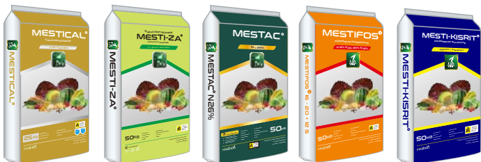
N Ca 15-26 N 21% N 26% NPS 16-20+12 MgO 27%